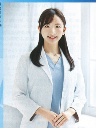
藤井先生オススメの施術

PROFILE ふんわり、日本形成外科学会専門医、国立病院機構 災害医療センター、東京女子医科大学病院 形成外科教室などを経て現職。美容医療を可愛イラストで解説するInstagram「みるくもち先生」(Instagram @dr.mikimochi) も大好評!